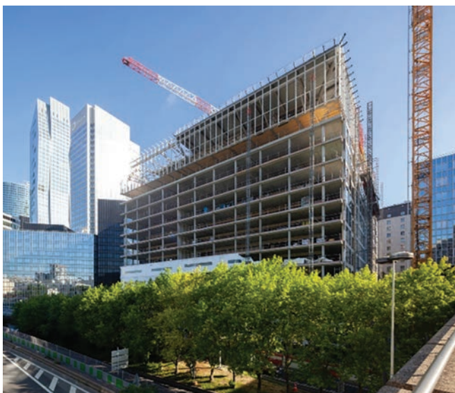
Carré Michelet, La Défense, Puteaux (92).

doc. Jean-François Tremège, Ets Carné, Valéry Jorcheray, Communauté de communes du Pays-de-Saint-Gilles-Croix-de-Vie