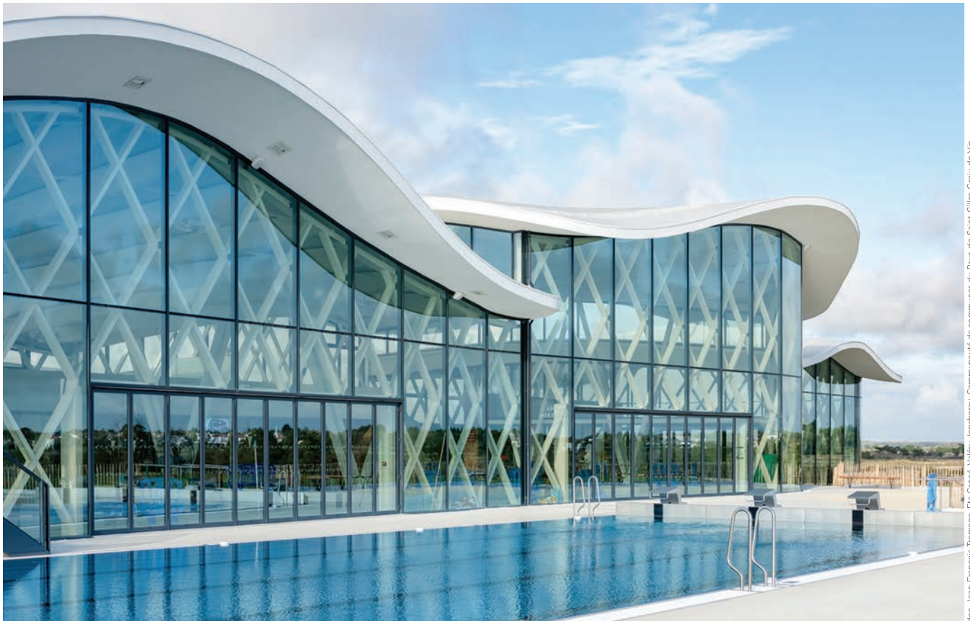
Multiplexe aquatique de Saint-Hilaire-de-Riez (85).