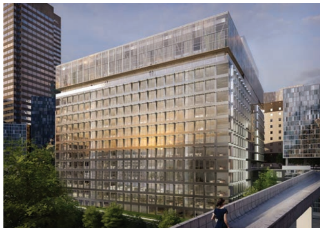
Doc. SCMF/Gagne/Crochon and Co/Architecture et Environnement/ Eiffage Construction Grands Projets/Orfeo Développement/Eurosic