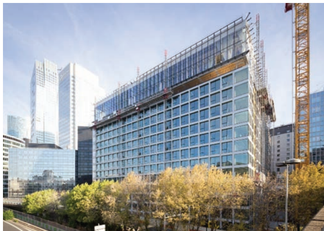
Doc. SCMF/Gagne/Crochon and Co/Architecture et Environnement/ Eiffage Construction Grands Projets/Orfeo Développement/Eurosic